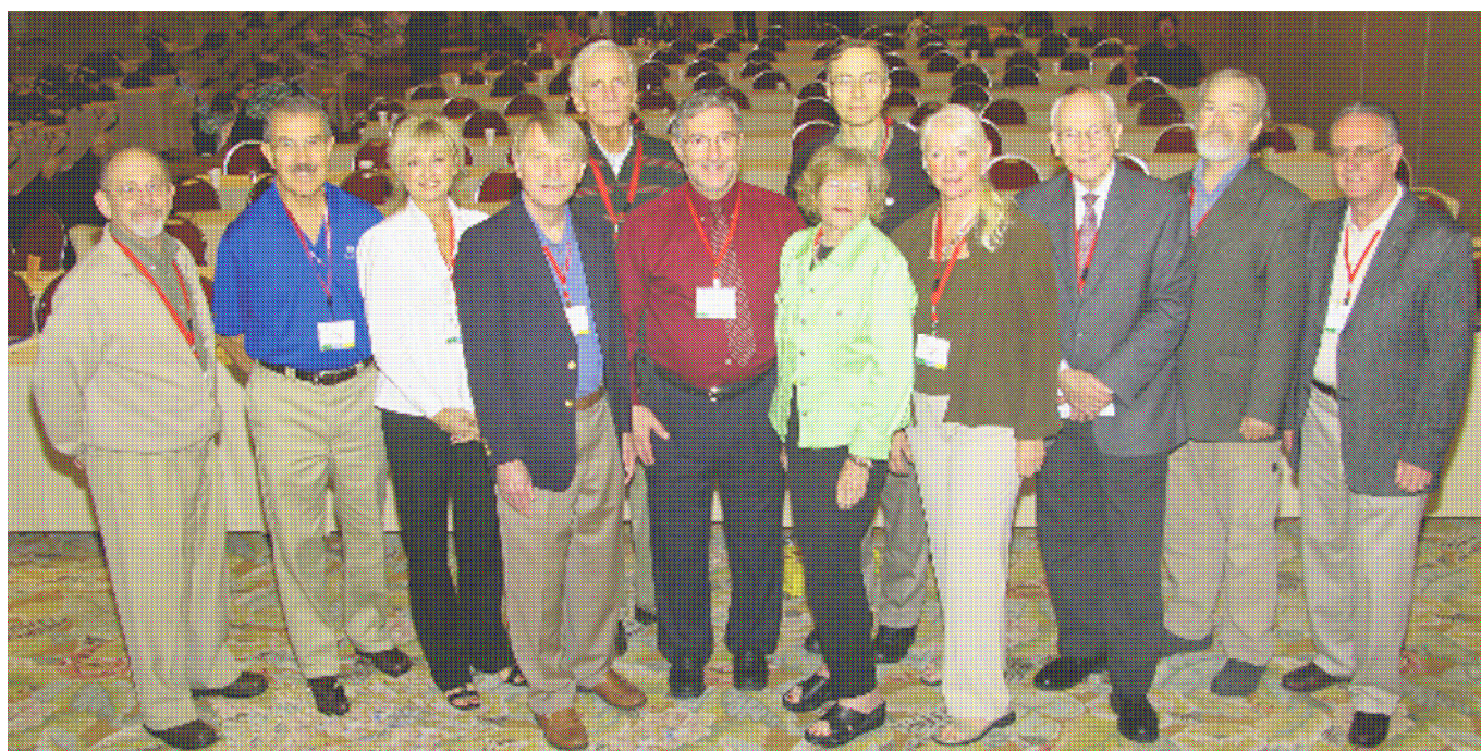
Le Conseil d'Administration en 2008